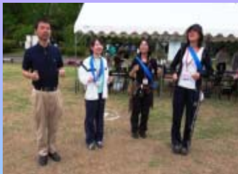
スロージョギング?