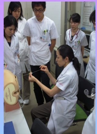
シミュレーター実習