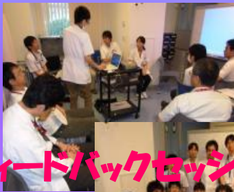
フィードバックセッション