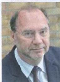
ピーター・ピオット