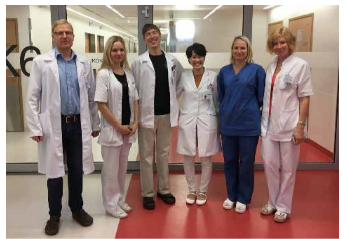
図4 Exchangeにて腫瘍外科チームと

【IFMSA】の活動の一つである「ぬいぐるみ病院」では、小児医療に興味のある医学・看護学生が集まり、子供たちと人形を使った模擬診療を主に行っています。子供の病院に対する不安や恐怖心を和らげると同時に、小児医療に対する理解を深めています。 その他、現在進行中の活動にグローバルヘルスゼミという勉強会があります。感染症をベースにどんなアプローチで解決していくかを公衆衛生の視点から調べ、ディスカッション等を行っています。また、年に二回の活動報告会や不定期でミーティングを開催し、部員が行っている活動をシェアする場を設けています。部員が新たに自分の関心を開拓する貴重な機会になっています。