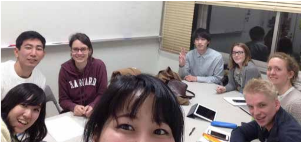
カザフスタン、ドイツ、フランスの留学生と一緒に海外の医療制度についてディスカッションしました。違いがたくさんあってとっても興味深い!

③最後に 高学年向けの内容ではありませんが、興味のある人は下記のアドレスまでご連絡ください。新メンバー、大歓迎です♪ eigoganhbarahb@gmail.com 西田 千紗