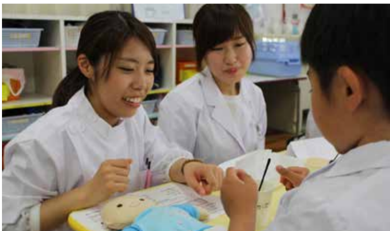
図2 ぬいぐるみ病院

こんにちは、熱帯医学研究会です！2年前に新体制で活動を開始し、熱研・IFMSA・Exchange・ぬいぐるみ病院という4部門にて、部員それぞれが自由に活動しています。 【熱研】部門では、熱帯医学研究所の先生方のサポートのもとで海外研修や勉強会を行っています。昨年のフィリピン研修に引き続き、この夏はベトナムで研修を行いました。日本では見られない熱帯感染症に対する臨床医療や、それに伴う熱帯地域ならではの医療設備を見学してきました。来夏はインドのホスピスにおける終末期医療の研修を計画中です。海外の終末期医療を学ぶことで、高齢化社会に直面している日本の終末期医療に対する理解を深めることが目的です。現在は事前勉強会や国内での実習を積み重ねている段階です。