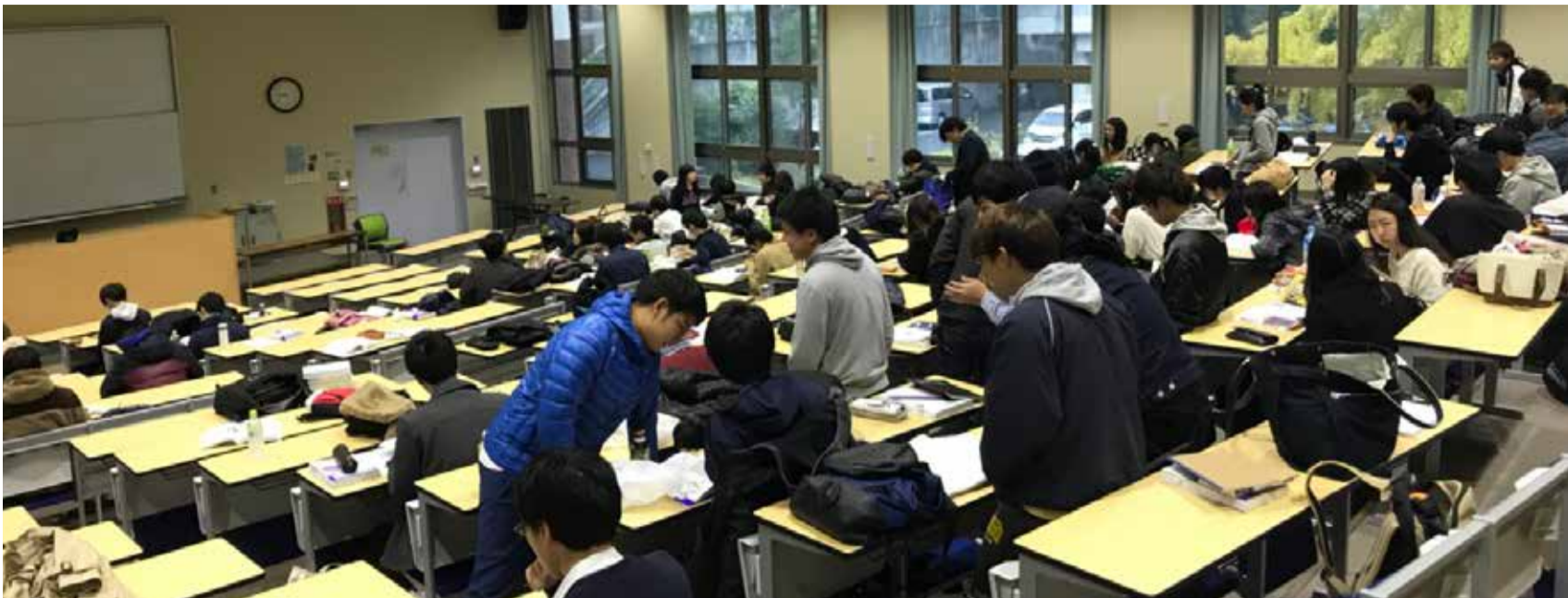
試験当日の待合室の様子

CBTを終えて 11月24日に私たち医学科四年生はCBT試験を受験しました。記事を書いている現在は、11月30日で結果は出ていません。結果が出ていない今、不安でいっぱいですが、振り返っていきいたいと思います。体験談のようなものなので、気楽にお読みください。 まずCBTとは、全国の医学科4年生が受けるプレ国試のようなもので、合格しなければ病院実習を行うことができないというシビアな試験です。 勉強には皆が使う参考書を使いました。参考書は4冊ほどあり、1冊が約600ページあります。5月くらいには参考書を手に入れましたが、見て見ぬふりをし、夏休みを存分に楽しんで、9月末からCBTに向けての勉強を開始しました。周りを見れば、すごく勉強をしている人もいれば、今から始める人もまだ焦る時ではないと達観している人など様々でした。私はまず、10月末にある模擬試験に向けて計画を立てました。試験範囲として比重の重いところは、参考書を2周、その他は1周確認する計画を。しかし、この計画は、1週間で無理だと気付きました。計画を実行するのであれば、寝る時間を究極に削るしかなかったからです。ここから2ヶ月の長丁場で、それは現実的ではないと考え、模擬試験までに、比重の重いところを1周