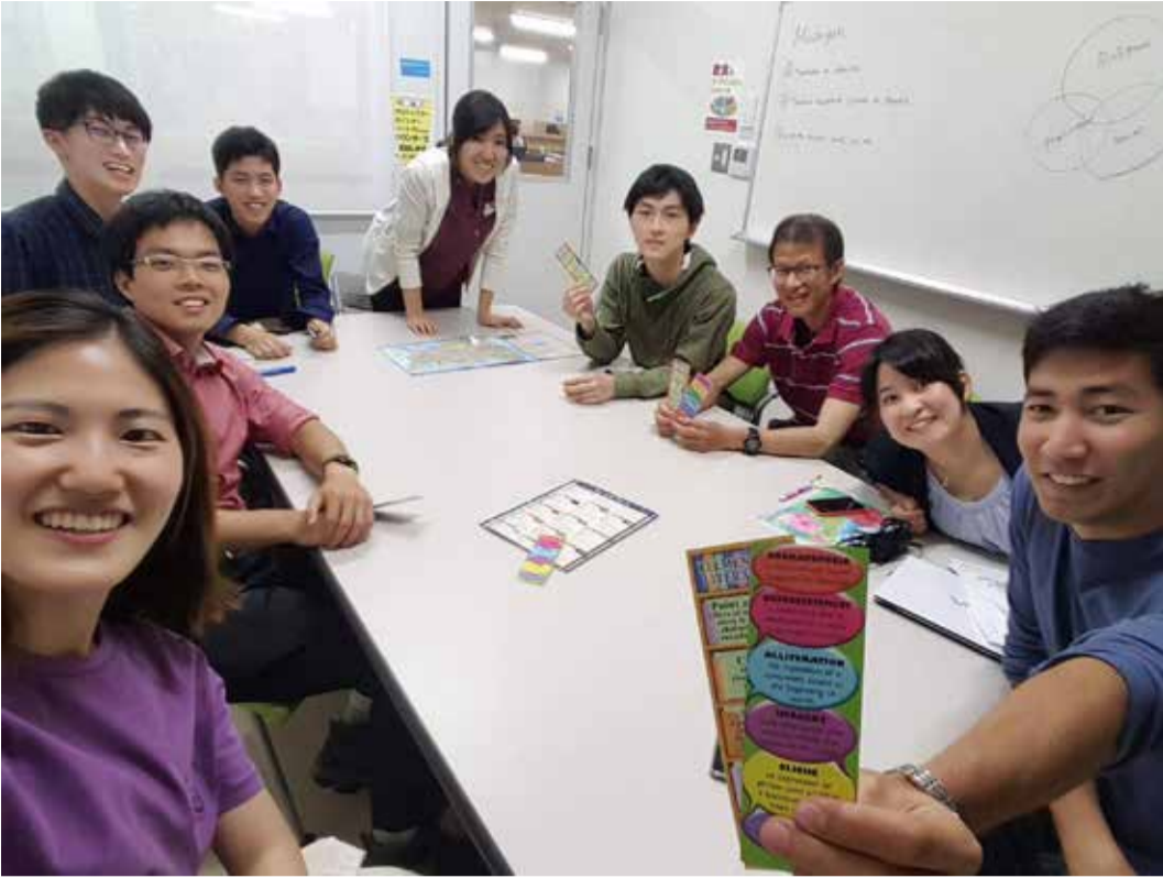
6年生による臨床実習in アメリカ報告会。後輩だけではなく、韓国とシンガポールの留学生も来てくれました♪

①きっかけ Monday Discussion Classは約一年ほど前に英語をもっと勉強したい、海外のことを知りたかったと有志が集まって始めた勉強会です。現在は、来年度に海外で臨床実習を行う予定の5年生を中心に、4年生から6年生まで約10人ほどが図書館のグループ学習室で活動しています。