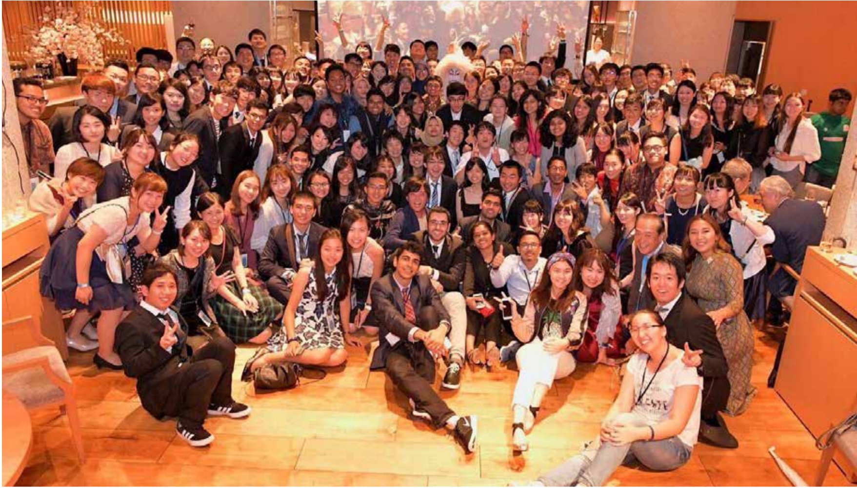
図1 IFMSA日本総会の様子