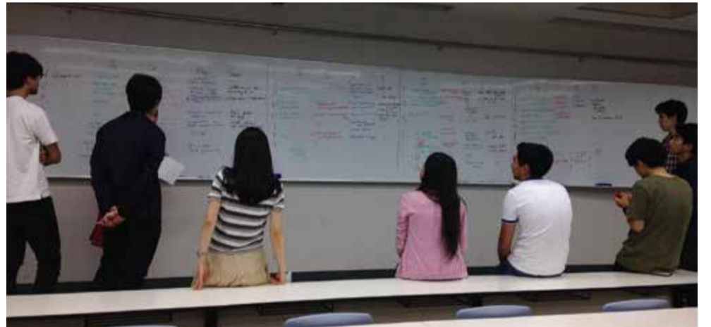
医療面接を終えた医師役が患者役から得た情報をみんなで共有します。新しい医療単語も学べるのでたくさんの収穫があります。