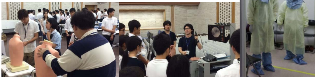
(写真は昨年度の実習体験の様子)