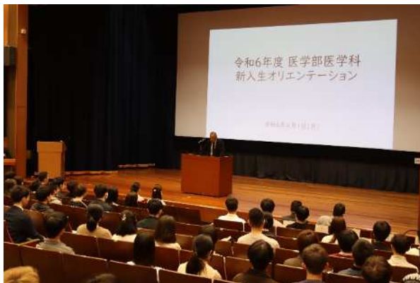
オリエンテーションの様子

そのほか医育センターによる学生生活のサポートに関する説明や、カウンセラーによる講話が実施され、新入生はこれからの大学生活に期待と不安を表情に見せつつも、真剣な様子で講話に耳を傾けていました。