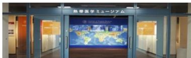
熱帯医学ミュージアム