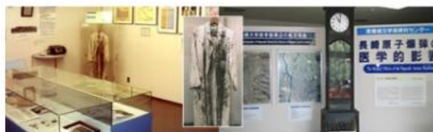
原爆医学資料展示室