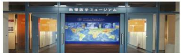
熱帯医学ミュージアム