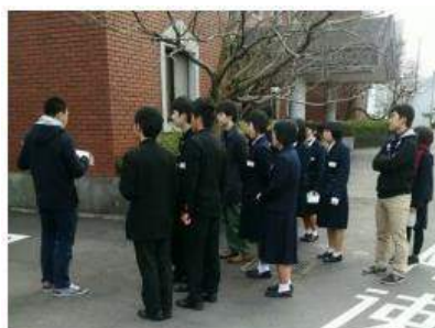
☆キャンパスを歩いたり☆