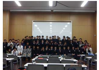
☆最後には記念写真も！☆