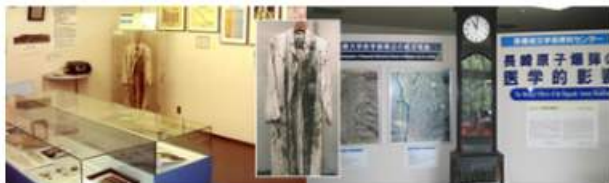
原爆医学資料展示室